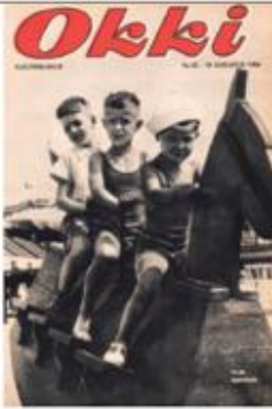
Greep uit 70 jaar Okki-covers: 1954