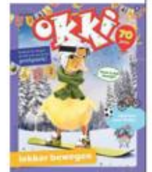
2024: 70-jarig jubileum.